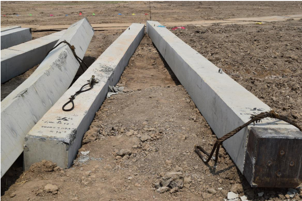
现场照片 2（拍摄方向由南向北）